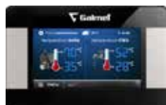
Фото 50 Сенсорный блок управления PELLASX S.Control Touch (опция)