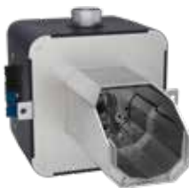
Фото 47 Гибридная горелка (Genesis Plus 10-34 кВт) с функцией автоматического очищения