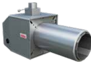
Фото 48 Поворотная горелка (Genesis Plus 62 кВт) с функцией автоматического очищения