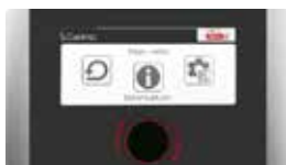
Фото 49 Блок управления PELLASX S.Control