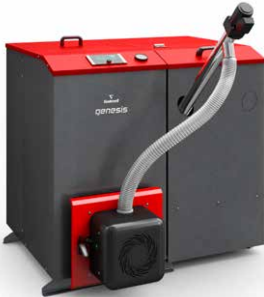
Фото 46 Котел Genesis Plus KPP 10 кВт с гибридной горелкой PELLASX